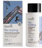
VOLUMIZING POWDER 8 g

Volumizing hair powder. Gives flat hair instant support and volume.