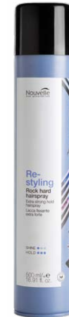
ROCK HARD HAIRSPRAY 500 ml

GEBRUIK: Aanbrengen op vochtig haar, of plukje voor plukje op droog haar, voor het gewenste effect.