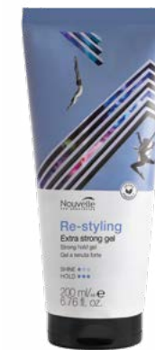
EXTRA STRONG GEL 200 ml

GEBRUIK: Aanbrengen op vochtig haar om vorm en textuur te geven, en vervolgens stylen.