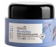
SOFT MOULDING PASTE 200 ml

GEBRUIK: Aanbrengen op droog haar en stylen om de gewenste stijl te creëren.