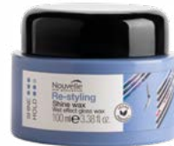
SHINE WAX 100 ml

GEBRUIK: Verdeel het product met je handen en breng het aan op vochtig of droog haar. Vorm het haar tot de gewenste stijl.