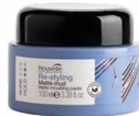
MATTE MUD 100 ml