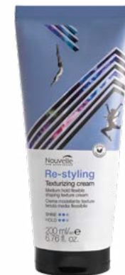
TEXTURIZING CREAM 200 ml

GEBRUIK: aanbrengen op vochtig of droog haar en vervolgens stylen.